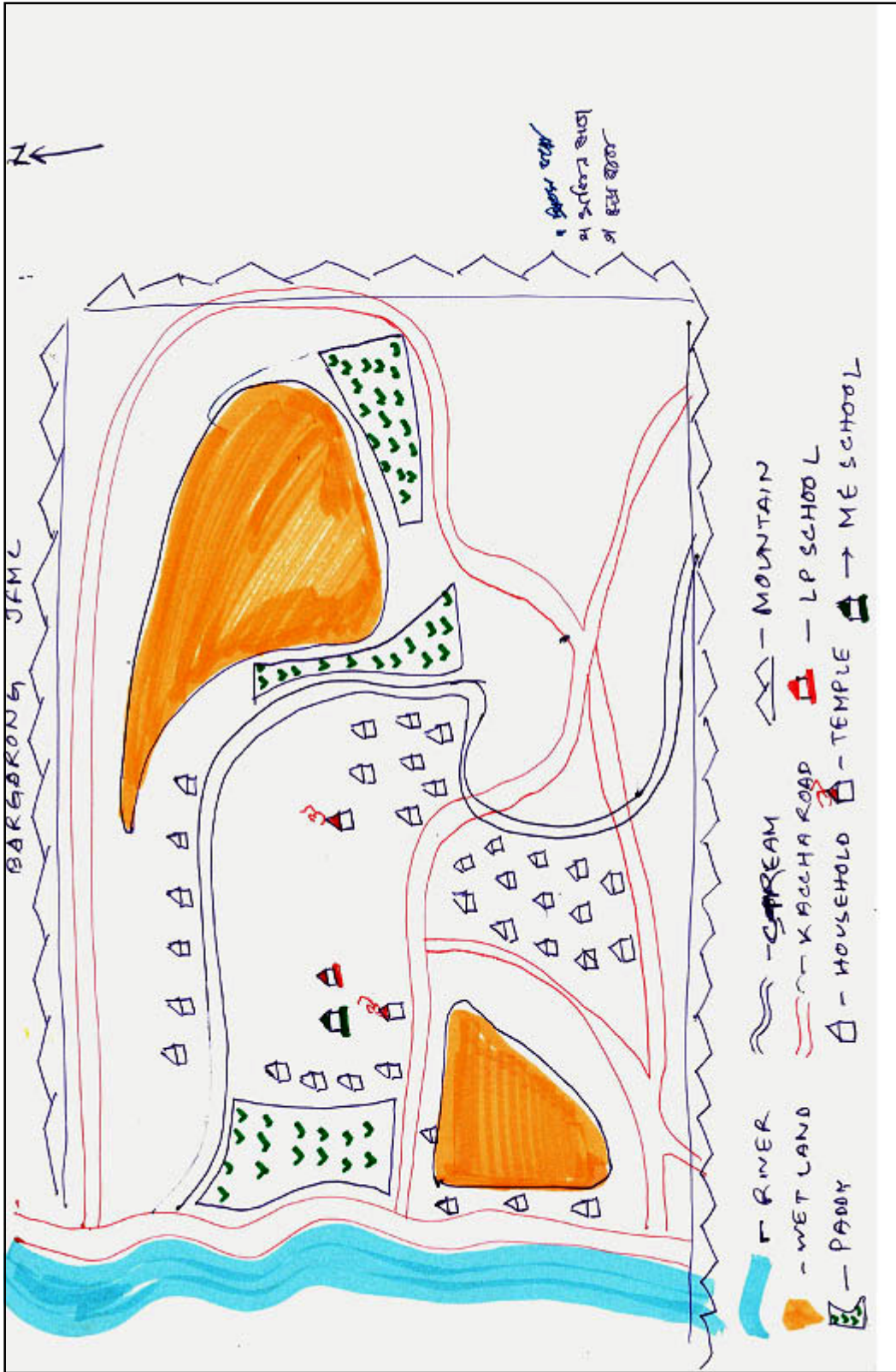
বৰগৰং জে এফ চিৰ সামাজিক আৰু সম্পদৰ মানচিত্ৰ